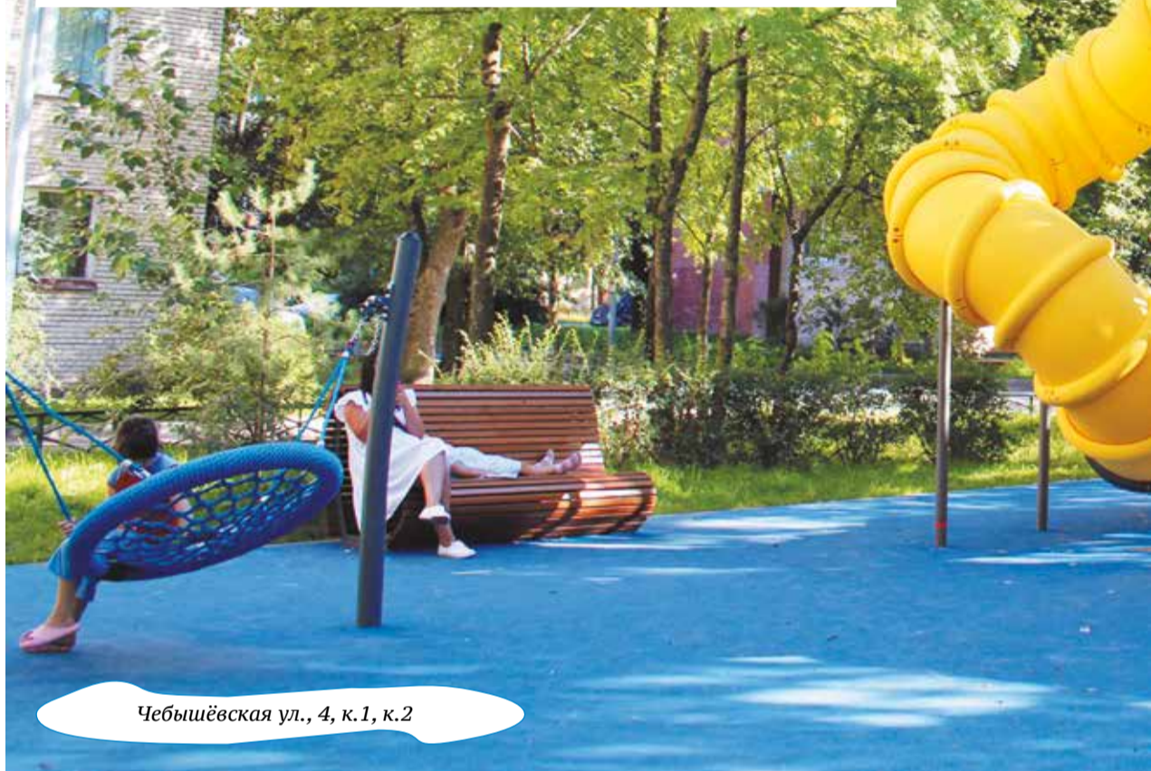
Чебышёвская ул., 4, к.1, к.2

На Разводной, 25, готова к установке фигур скейт-площадка для катания на самокатах, скейтбордах, трюковых велосипедах. Здесь будет смонтирован комплекс радиусов «полупулл», «квотер», «двойной квотер», «подкат», «фанбокс с рейлом», «флайбокс».