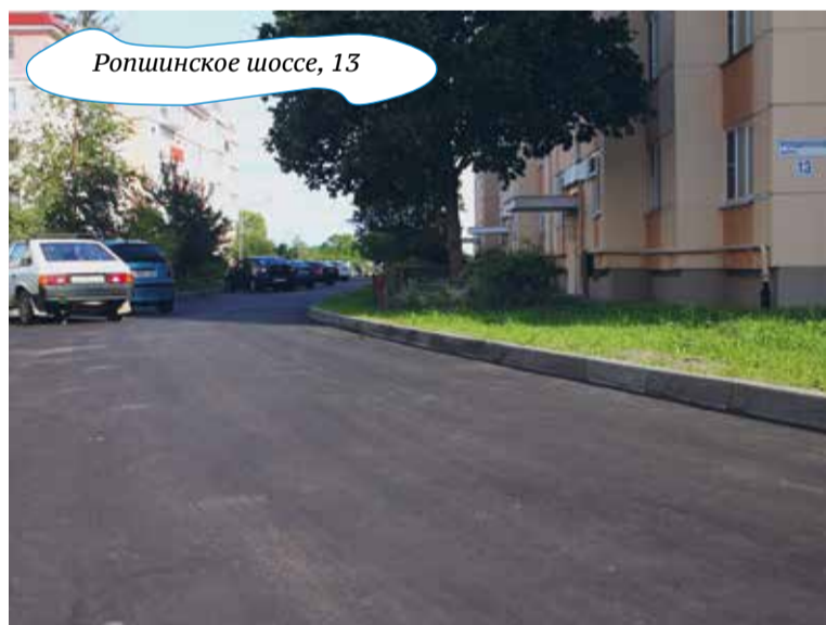
Ропшинское шоссе, 13

Обновили дорожное полотно на Баушевской улице. Ремонт провели с устройством двухслойного основания, выполнили регулировку колодцев, сделали уклоны для стока поверхностных вод, обустроили обочины и газон.