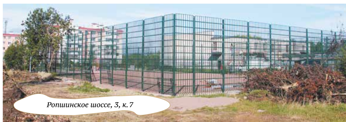
Ропшинское шоссе, 3, к.7

жёров. Площадка будет с наружным освещением. На Ропшинском шоссе, 3, к.7, ведётся строительство поля для мини-футбола с площадкой для тренажёров.